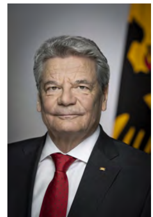
Joachim Gauck, Präsident der Bundesrepublik Deutschland